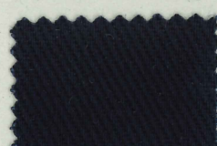
62 ミッドナイトブルー