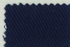
12 プリジャンブルー