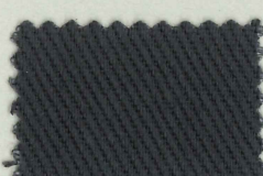
64 チャコールグレー