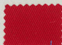
D276 イタリアンレッド