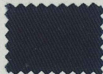
D8 オックスフォードブルー