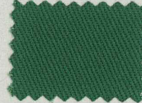
☆ D102 ベリルグリーン