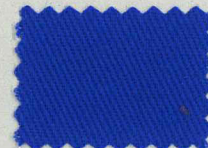
M114 プリンセスブルー