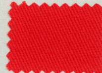
☆ M233 カージナルレッド