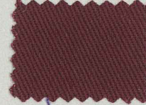
☆ D253 ボルドー