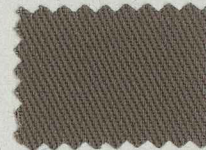
☆ D258 スモーキーブラウン