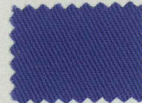
☆ D222 グレイパール