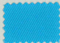
M235 ターコイズブルー