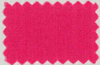
M41 ハワイアンピンク