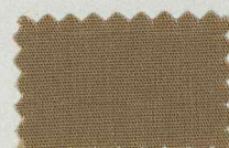
M39 ブラウンベージュ