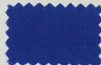
D30 ミディアムブルー