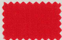
D31 カーディナルレッド