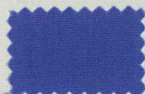
D43 アイランドバープル