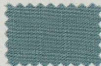
M38 グリーンシェイド