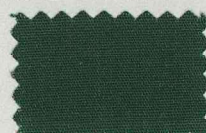
D28 ディープグリーン