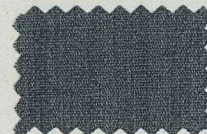
M21 チャコール空グレー

注：C/#20、21、37につきましては、空調に仕上げる為、ネップ、スラブが出る場合があります。 *MAY FIND NEPS AND SLUBS ON COL#20&21&37 DUE TO MELANGE COLOR