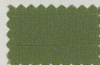
M42 マラカイトグリーン