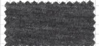
12 ライトモクグレー