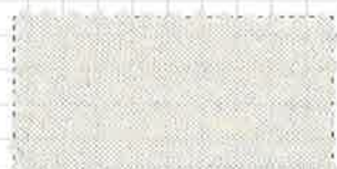
22 ホワイトスモーク