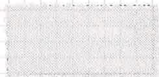
24 ウォーターピンク