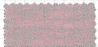
26 ラベンダーピンク