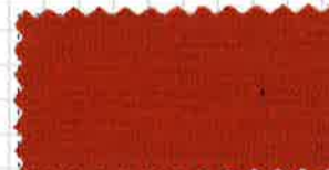
30 オレンジブラウン