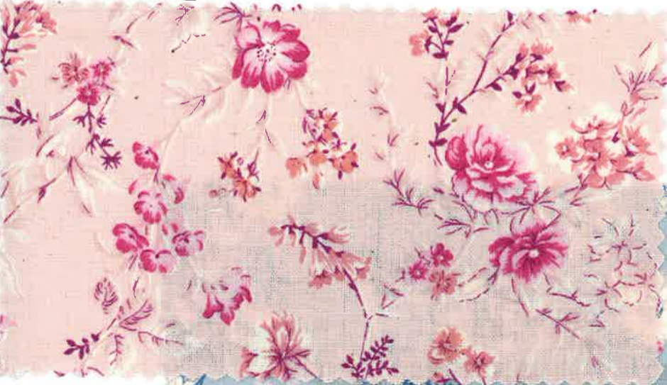
2-4 sweet rose