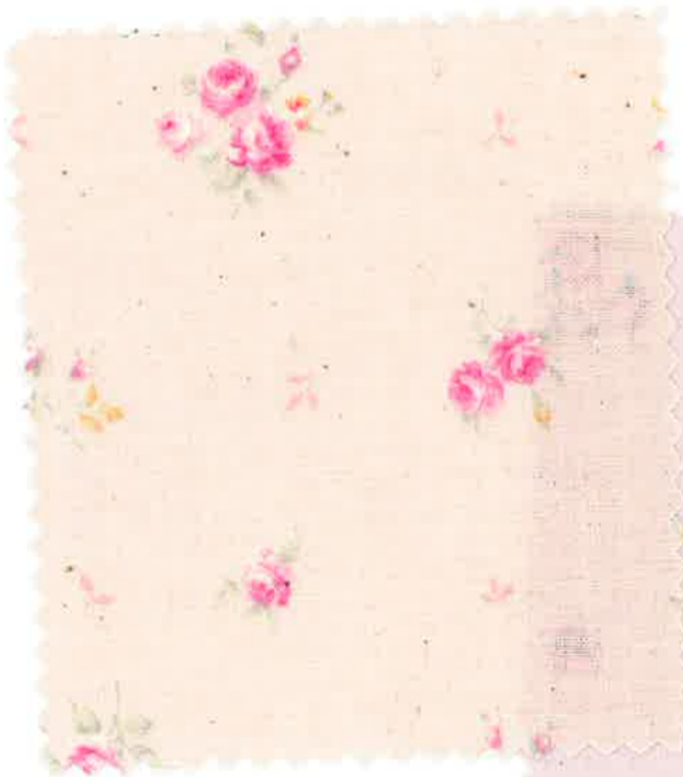
1-5 sugar pink