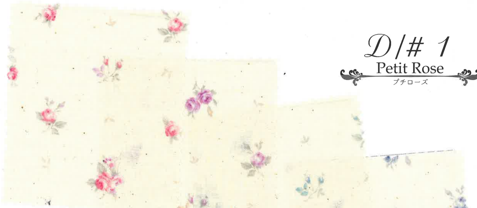
1-1 natural × pink