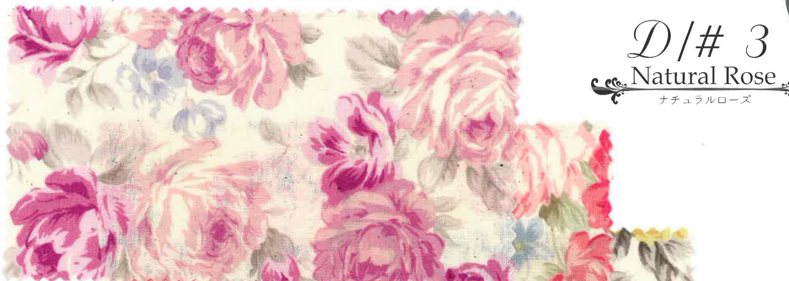
3-1 natural x lilac