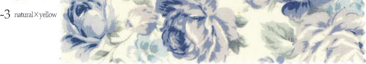
3-3 natural x yellow