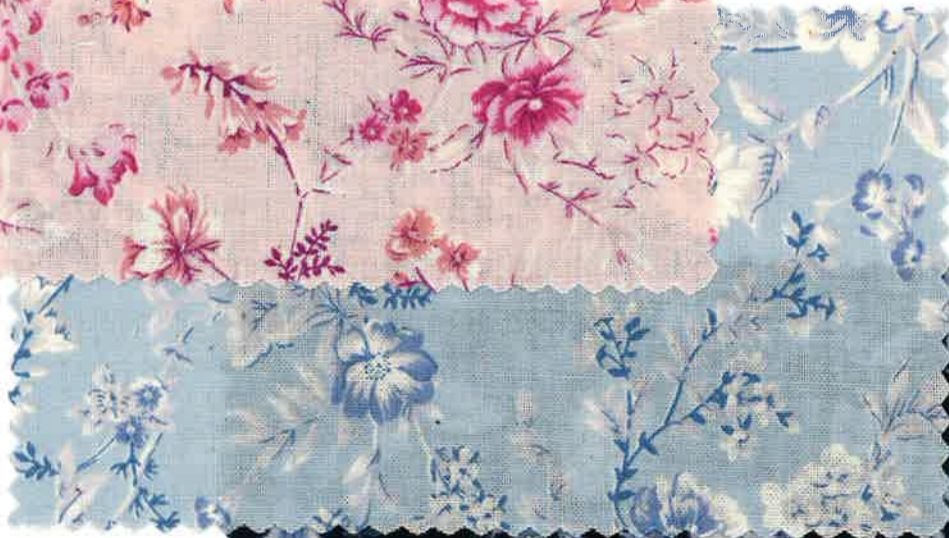
2-5 powder blue