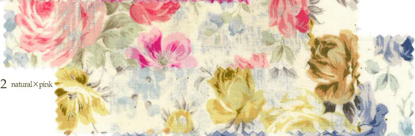
3-2 natural x pink