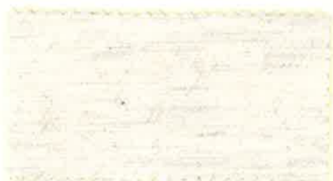
オートミールモク