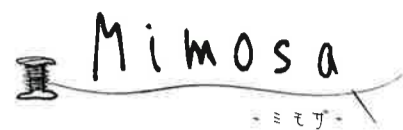
D/#1 『Mimosa』 -ミモザ-

※本商品は麻混の生機を使用しており、麻本来の素材感を損なわない様、生成りベースで加工しております。生機のロット違いによるロットフレが生じる可能性もあります。又、生成りベースに加工により、色ムラ・ネッス・スラスが出易くなっています。上記事項は商品の特性ですので、ご了承の上裁断・加工して頂きます様、宜しくお願い致します。