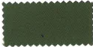
5 ミリタリーグリーン