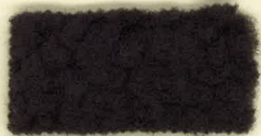
チャコールグレー