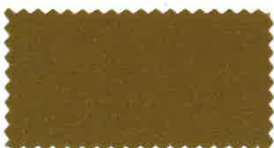
ブラウンベージュ