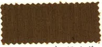
キャメルベージュ