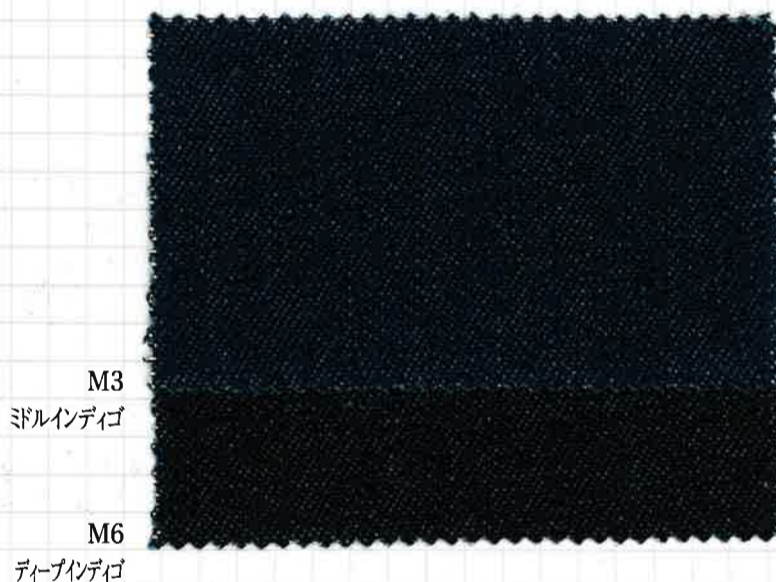
〈512〉 インディゴ12ozデニム COTTON YARN DYED DENIM 148/149cm×50m C-100% ソフト加工