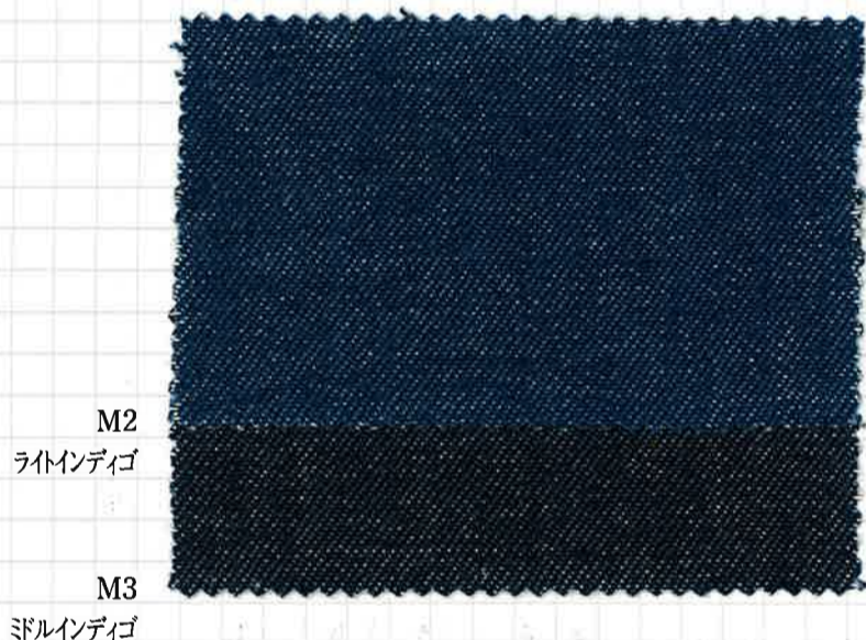
〈508〉 インディゴ8ozデニム COTTON YARN DYED DENIM 144/145cm×50m C-100% ソフト加工