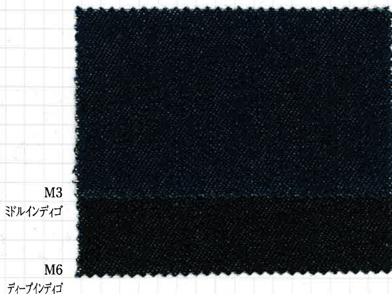
〈512〉 インディゴ12ozデニム COTTON YARN DYED DENIM 148/149cm×50m C-100% ソフト加工