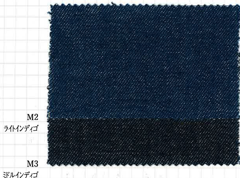
〈508〉 インディゴ8ozデニム COTTON YARN DYED DENIM 144/145cm×50m C-100% ソフト加工