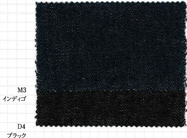
〈518〉 インディゴ8ozデニムヨコストレッチ COTTON POLYURETHANE YARN DYED STRETCH DENIM 133/135cm×50m C-95% Pu-5% ソフト加工