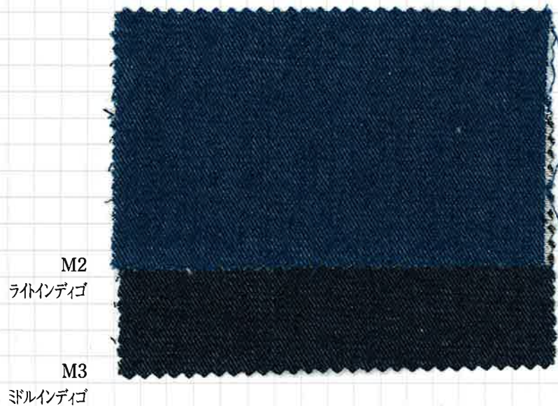
〈505〉 インディゴ5ozデニム COTTON YARN DYED DENIM 144/145cm×50m C-100% ソフト加工