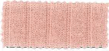
8 グレイッシュピンク