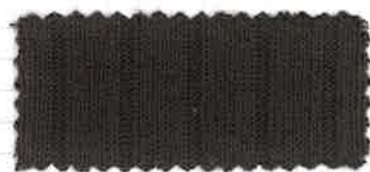
9 チャコールグレー