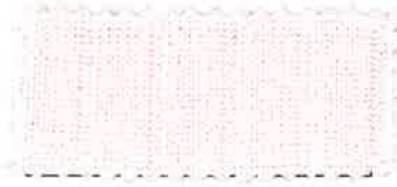
7 ウォーターピンク