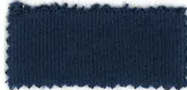
219 トゥルーネイビー