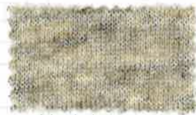
4 ミックスオートミール