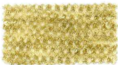
7 ヴィンテージイエロー