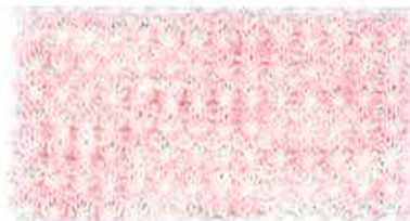
8 ヴィンテージピンク