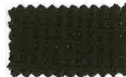
76 ディープグリーン