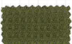
299 ディープオリーブ