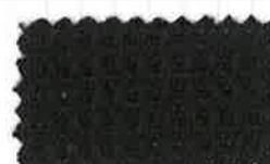
☆58 チャコールグレー