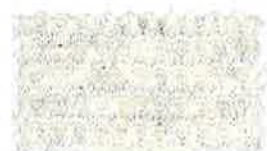
100 オートミルクモク(GR3)