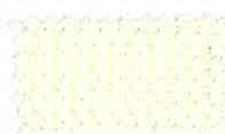
161 クラウドクリーム