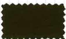
22 アイビーグリーン