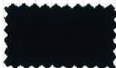
40 インディゴブルー