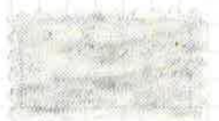
100 オートミールモク(GR3)