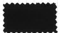
26 チャコールグレー