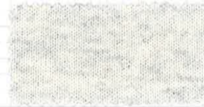
100 オートミールモク(GR3)

※企画立案及びご購入に際しては、右記ホームページにて色柄・在庫状況をご確認の上、ご用命下さい。