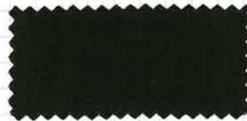
ディープグリーン