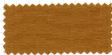
オレンジベージュ