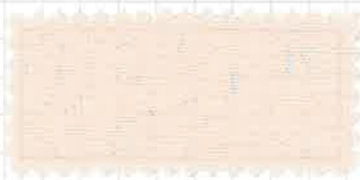
ダスティーピンク