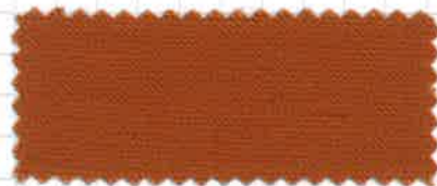
ダスティーオレンジ