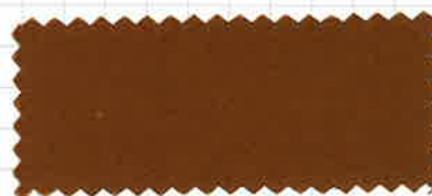
ブラウンベージュ