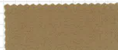
ブラウンベージュ