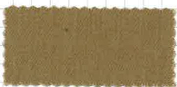
ブラウンベージュ