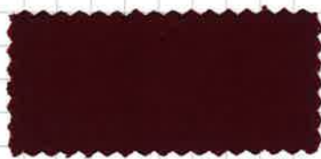
ディープボルドー