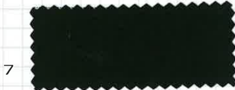
ダスティグリーン