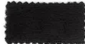
※58 チャコールグレー