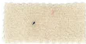
※26 スモークベージュ