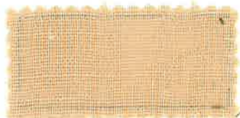
5 ナチュラルシアン