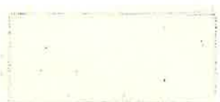
501 キナリカスノコシ