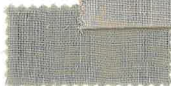
4 ナチュラルグレー