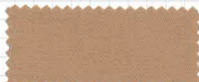
スモーキーピンク