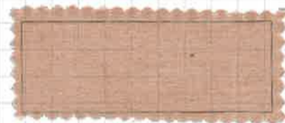
スモーキーピンク